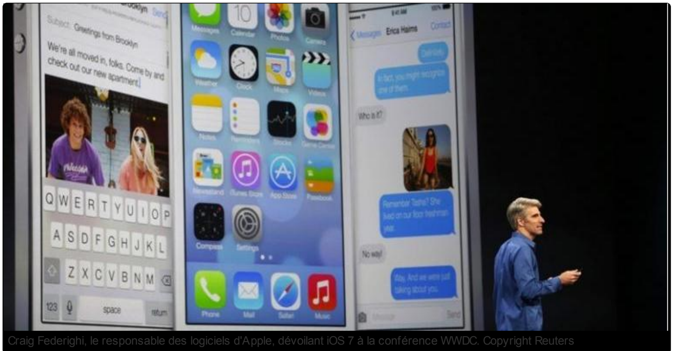
Craig Federighi, le responsable des logiciels d'Apple, dévoilant iOS 7 à la conférence WWDC.