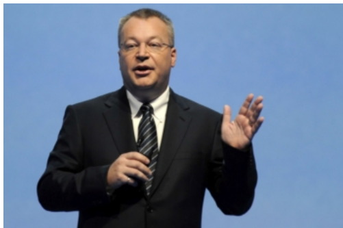
Stephen Elop admitiu estar "desapontado"

A Nokia tem sido a imagem de um gigante em queda. A empresa finlandesa teve 929 milhões de euros de prejuízos no primeiro trimestre deste ano. Em 2011, tinha tido lucros de 344 milhões.